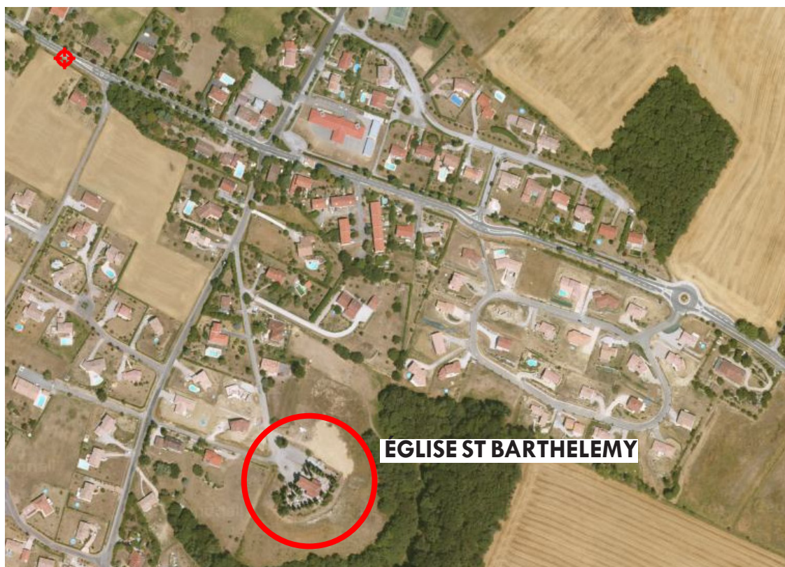
Situation de l'édifice